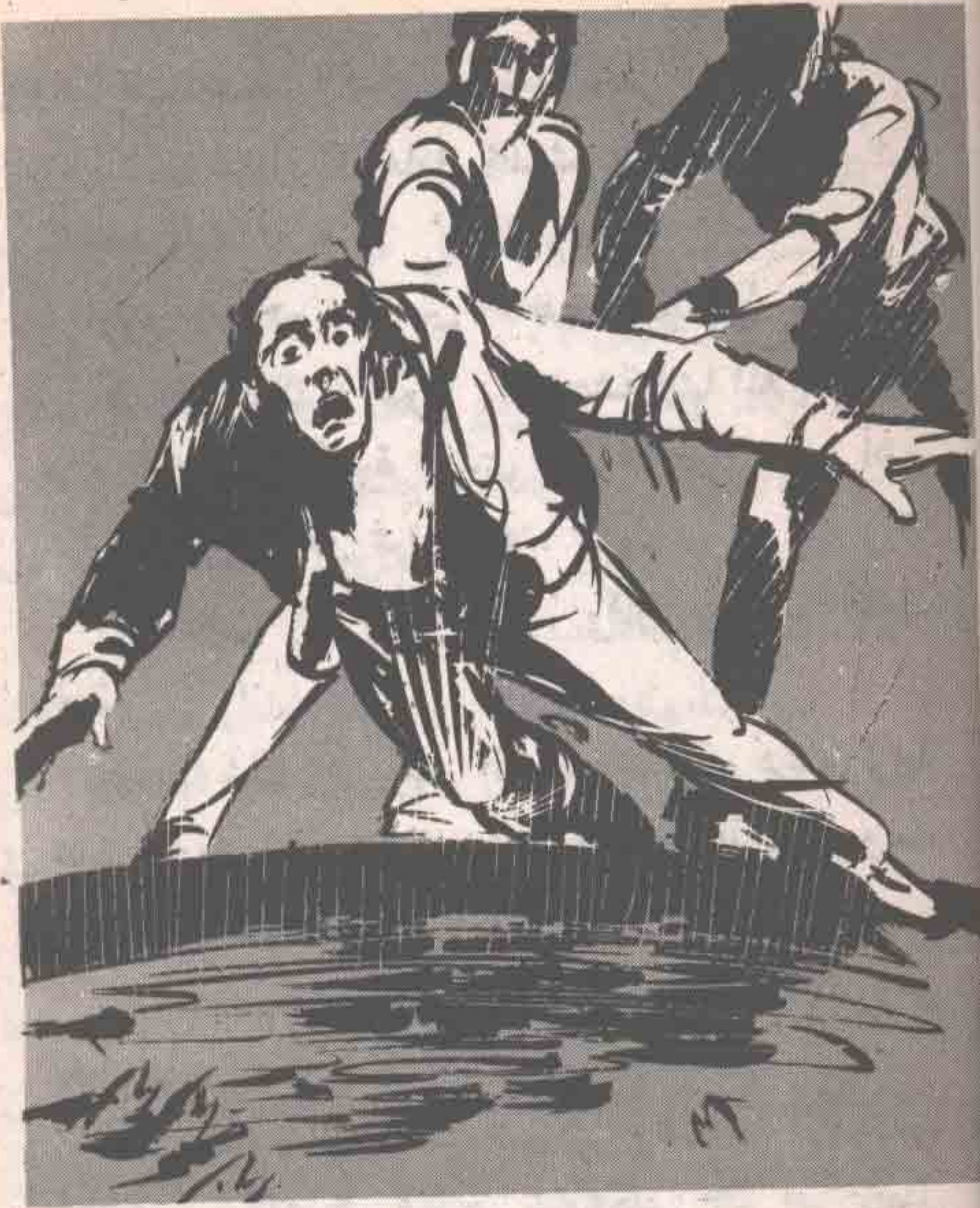
ولكن الرجال الآخرين دفعوه بقسوة لیسقط فی البركة وهو یصرخ بفرع أثار رعب ( هويدا ) ..

احتقن وجه ( أدوين ) المكتظ غضبا ، وأشار لرجالہ بإلقاء الرجل فی البركة ، غير مبال بصرخات الرعب وصیحات التوسل التي أطلقها الرجل ، وهو يحاول الإفلات ، ولكن الرجال الآخرين دفعوه بقسوة لیسقط فی البركة وهو یصرخ بفرع أثار رعب ( هويدا ) .