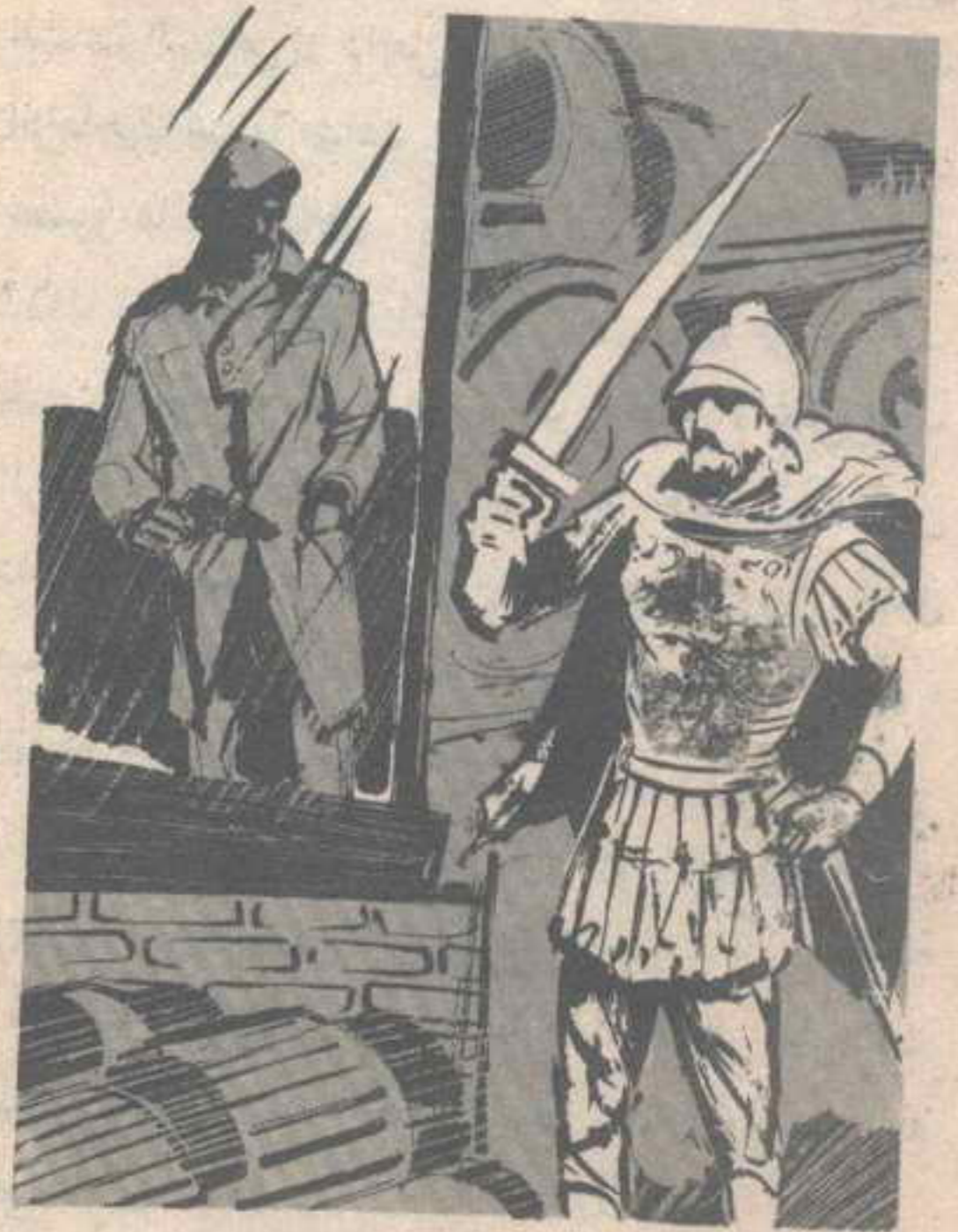
شاهد رجلًا يرتدى ملابس تعود إلى عصور ما قبل الميلاد ، ويمتشق سيفًا حديدياً ..

— وقبل أن يستعيد الجميع هدوءهم بعد هذا الموقف المخيف ، وفي الصباح الباكر وأمام عيون الجميع ، ارتفعت إحدى آلات الحفر التي تزن ما يقرب من طنين عن سطح الأرض حوالى ثلاثة أمتار ، وظلت معلقة دون أن يجزؤ أحدهم على الاقتراب منها ، ثم