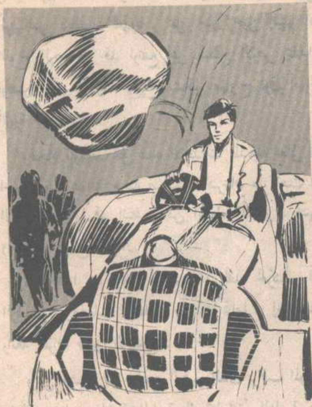
ودون أدنى تردد ضغط ( نور ) زر الحركة غير مبال بجلمود الصخر ، الذى يندفع نحوه ..

ودون أدنى تردد ضغط ( نور ) زر الحركة غير مبال بجلمود الصخر ، الذى يندفع نحوه ، ولدهشة الجميع وأمام عيونهم المتسعة من فرط الدهول تلاشى الجلمود الضخم فى الهواء قبل أن يصل إلى ( نور ) ،